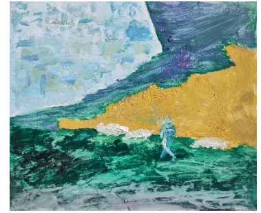
Chefchaouen, Hirt I Öl auf Glanzpapier (2022)