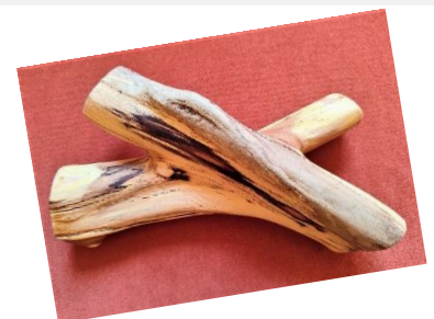
Unzertrennlich Holz (2022)