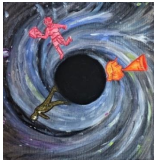
Macbeth 5, 5 (William Shakespeare), Acryl & Filzstift auf Leinwand Collage (2020)