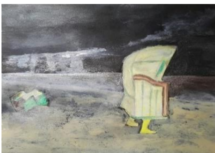
Strandkorb auf der Flucht Acryl auf Papier (2021)