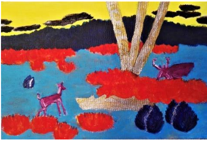
Schönower Heide im August Acryl auf Leinwand (2020)