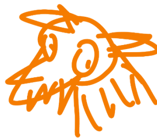
Looping App simple draw (2019)