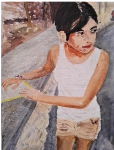
Loubna bei Echall'arts Acryl auf Leinwand (2019)