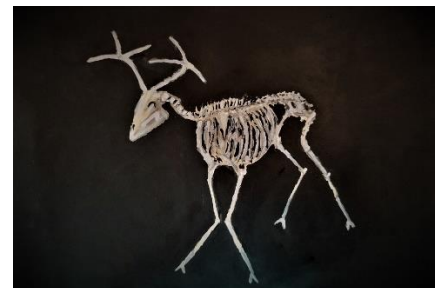
Anonymes X-Rel in Röntgental Acryl auf Karton (2022)