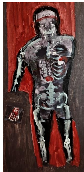
Selbstbildnis als Krankenakte Acryl & Collage auf Leinwand (2022)