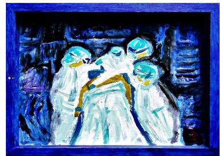
24.12.2021, 24.00 Acryl auf Papier (2021)