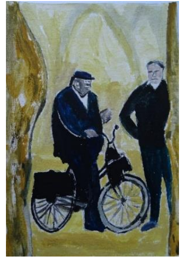
Place du marché d'Uzès I Aquarell auf Papier (2018)