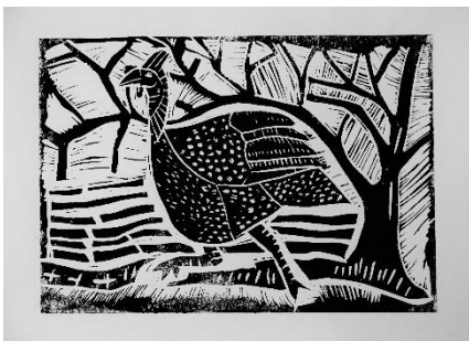
Guinea fowl Linoldruck auf Papier (2018)