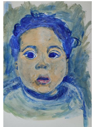
Hana, Acryl auf Malkarton (2022)