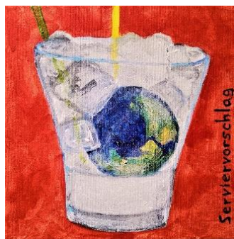
Serviervorschlag Acryl auf Leinwand (2021)