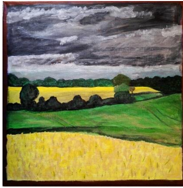
Rapsfelder, Schleswig-Holstein I Acryl auf Leinwand (2021)