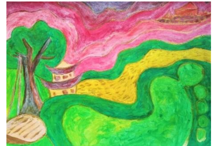
Barfuß Buch: Mauerfalle (Dang Lanh Hoang) Acryl auf Papier (2020)