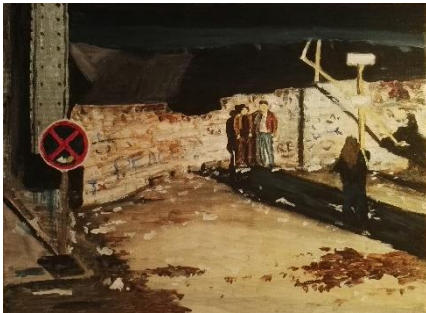
Wollankstraße (Berlin November 1989) Buch: Mein Kalter Krieg (JP Bouzac) Acryl auf Leinwand (2019)