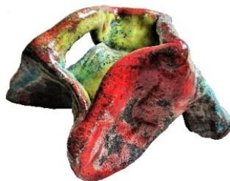
Hommage à Vallauris Raku (2012)