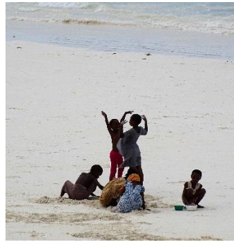
Kinder am Strand auf Zanzibar Foto (2015)