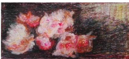
Pfingstrosen IV Kreide auf Papier (2019)