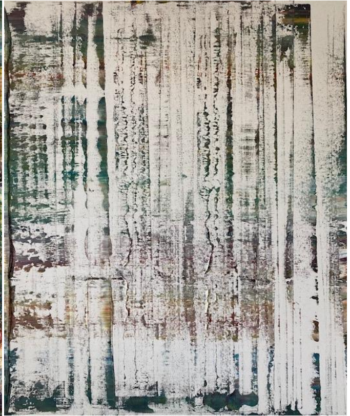
„Leise“ Diptychon 2/2