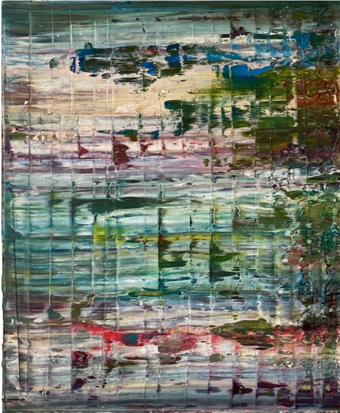
„Laut“ Diptychon 1/2