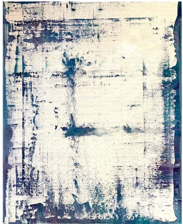
„Stille“ Diptychon 2/2